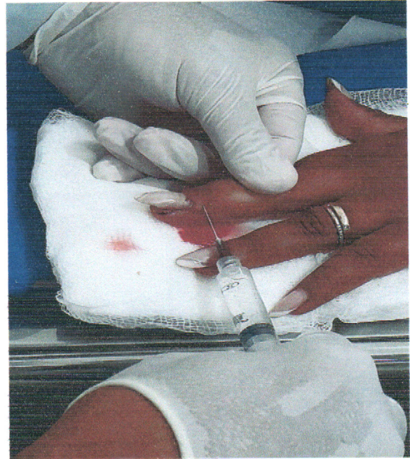
paciente com avulsão