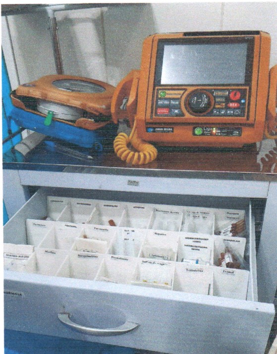
Carrinho de parada.